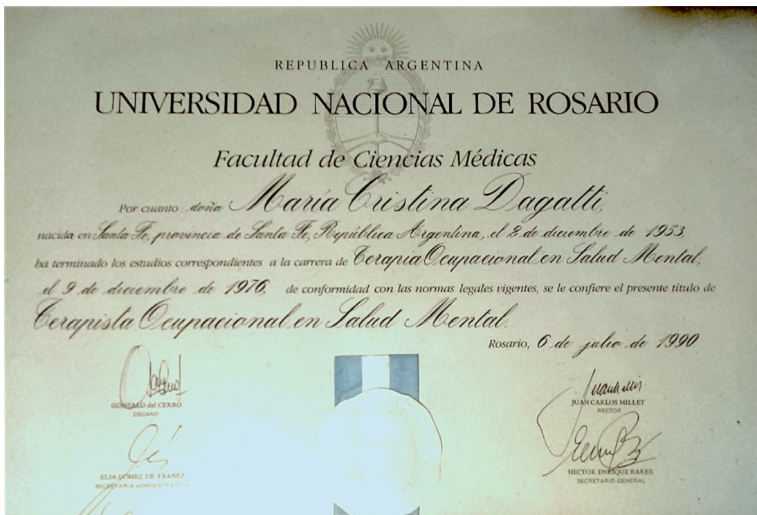
Figura 1: Título de Terapeuta Ocupacional en Salud Mental expedido por la Facultad de Ciencias Médicas de la Universidad Nacional de Rosario.

Dicha resolución se hizo efectiva en 1990 durante el decanato del Dr. Gonzalo del Cerro, a través de un acto de colación donde participaron las 17 egresadas contactadas.